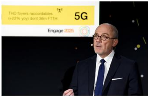
Stéphane Richard