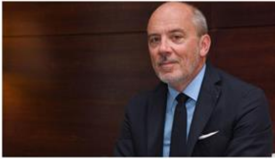
Stéphane Richard, PDG d'Orange